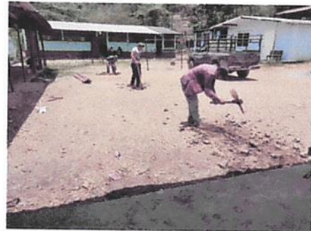
Foto 2: marcación y sanjeo previo a la fundición del piso de concreto