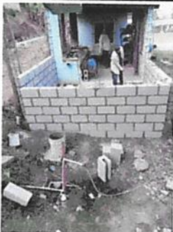
Foto 5: remozamiento y levantamiento de paredes de block en área de cocina